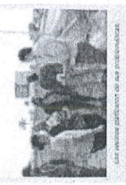
Alcalde Cuernavaca Villalón con algunos funcionarios de las obras.