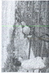
Los trabajos de puente de Juárez, avance del 98% en la altura de la colonia Parque Juárez.

Las columnas que se van beneficiando serán: Boca Grande, Parque Juárez, Zona y Fraccionamiento Las Letras y a través de subestructuras con dimensiones cercada por una estructura.